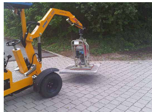
Ugradnja Magna ploča vakuum strojem.