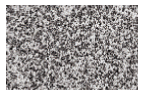
granit prana - belo-crna