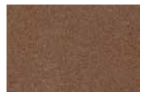
kvarc jednobojna - braon