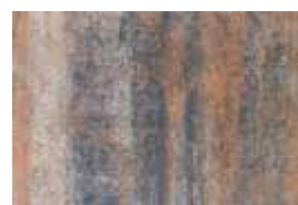
kolormix - školjka