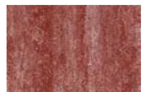
kolormix - terakota mix