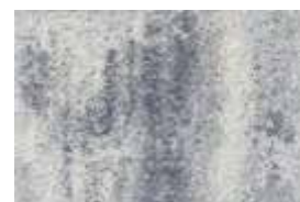
kolormix - bianco