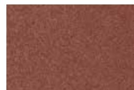
kvarc jednobojna - bordo