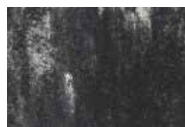
kolormix - antracit