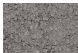
jednoslojna - cement siva