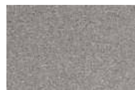
kvarc jednobojna - cement siva