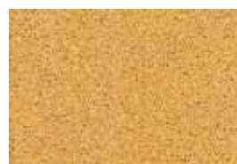
kvarc jednobojna - žuta