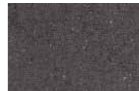
kvarc jednobojna - crna